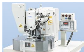
全回転3倍釜仕様 電子門止めマシン LK-1942ZA/5050 (2012年5月認定) 製品詳細情報はこちら