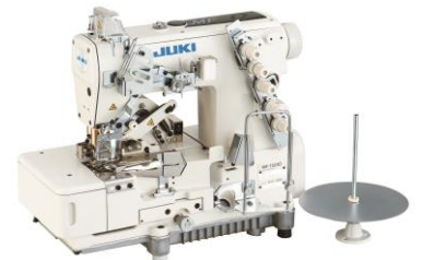
高速フラットベッド 両面飾り偏平縫いマシン (ユニバーサルタイプ) MF-7500/UTシリーズ (糸切り仕様) (2012年11月認定) 製品詳細情報はこちら