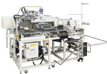
ポケットセッター(ジーンズ仕様) AP-876 (2012年2月認定) 製品詳細情報はこちら