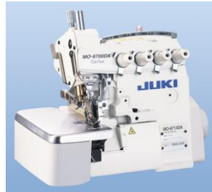
セミドライヘッド 高速オーバーロック/ インターロックマシン MO-6700DAシリーズ (2012年11月認定) 製品詳細情報はこちら