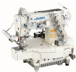
高速シリンダーベッド 両面飾り偏平縫いマシン (ユニバーサルタイプ) MF-7900/UTシリーズ(糸切り仕様) (2012年11月認定) 製品詳細情報はこちら