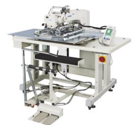
入力機能付き 電子サイクルマシン AMS-221EN-HS3020SZ /7200 (2012年3月認定) 製品詳細情報はこちら