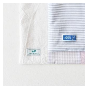
▲制作する「ミニバッグ」(イメージ)

本ワークショップでは、CHECK&STRIPE の生地と JUKI の職業用ミシン「SL-700EX」と「SL-300EX」を使用して、ミニバッグを制作いただきます。CHECK&STRIPE の素敵なハギレの中から好みの生地を選び、世界に一つだけのバッグ作りをお楽しみいただけます。