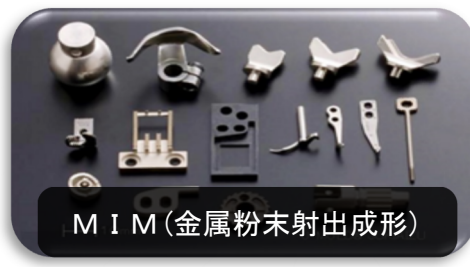
MIM（金属粉末射出成形）