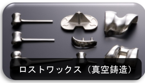
ロストワックス（真空 casting）