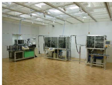
(写真左:ジーンズ前立て 右:ジーンズ前立て生地に合わせてファスナーと生地端を自動縫製する装置)

2018年10月にお客様であるジーンズ縫製工場に装置を導入し、生産を開始しております。ロボットアームを活用した縫製や生地の自動搬送などの技術を用いてファスナー付けの合理化を実現。縫製作業の自動化、生産性の向上、縫い品質の安定、熟練や技能に依存しない生産を可能にしました。