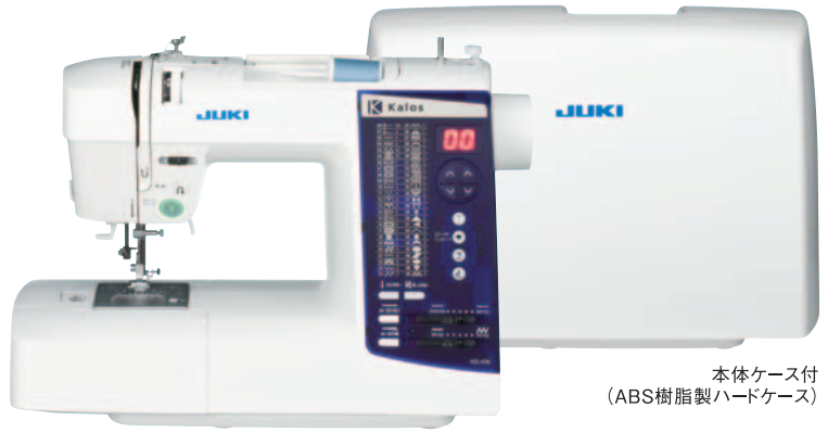
本体ケース付 (ABS樹脂製ハードケース)