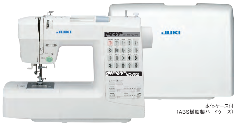
本体ケース付 (ABS樹脂製ハードケース)