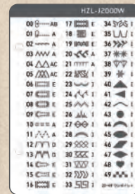
模様一覧シート (同梱)