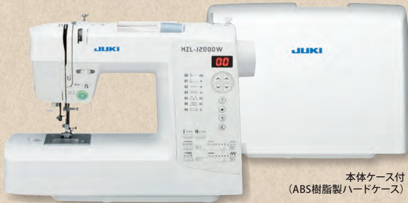
本体ケース付 (ABS樹脂製ハードケース)