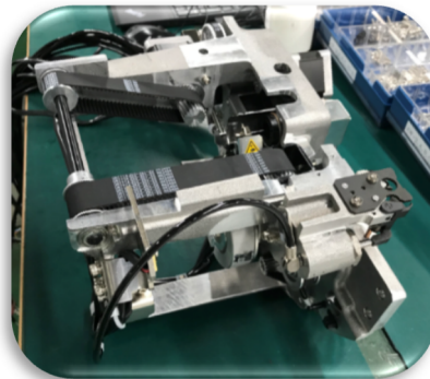
ユニット・基板組立