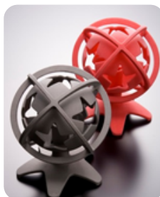
ロストワックス （精密鋳造）