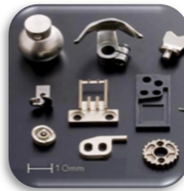
MIM(金属粉末射出成形)