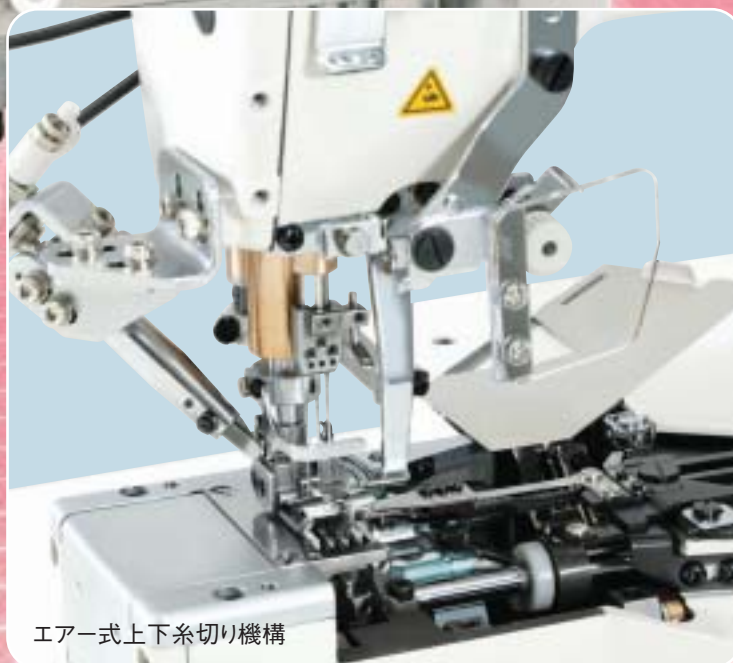
エア一式上下糸切り機構