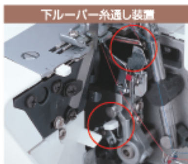
下ルーバー糸通し装置

まっすぐな溝にそって糸を通すだけで、糸調子に糸がかかりますので、間違えたりすることなく簡単に糸がかかります。押えを上げると同時に皿が開いて、太い糸でも簡単に通ります。