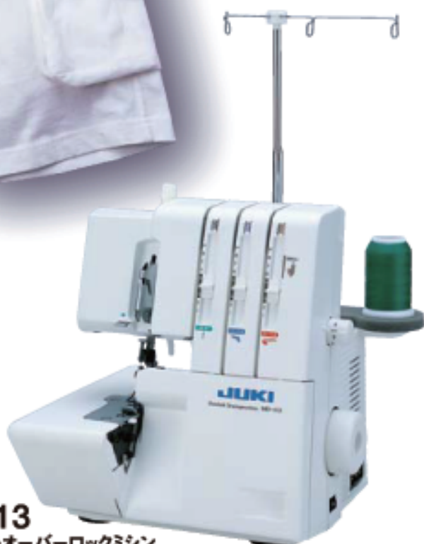
MO-113 1本針3本糸オーバーロックミシン