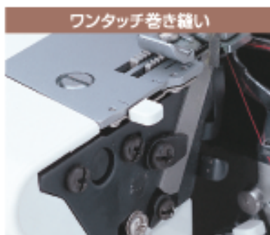
ワンタッチ巻き繻い

全巻さと細ロックの2種類の巻き繻いは、かがり幅切り替えつまみを操作するだけのワンタッチ操作です。