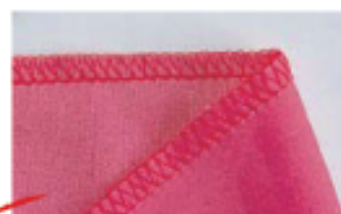
3本糸縫かがり縫い

単なる縫かがりだけでなく、2枚以上の縫い合わせや、 すそ引き縫いから巻ロック、ゴムやテープ入れまで、 「えっ、こんなことまで出来るの!」と言うのがロックミシン。 今まで知らなかったソーイングの世界が 一気にひろがります。