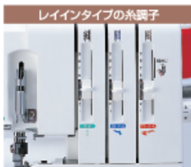
レインタイプの糸調子

まっすぐな溝にそって糸を通すだけで、糸調子に糸がかかりますので、間違えたりすることなく簡単に糸がかかります。押えを上げると同時に皿が開いて、太い糸でも簡単に通ります。