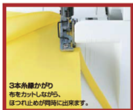
3本糸縫かがり 布をカットしながら、 ほつれ止めが同時に出来ます。