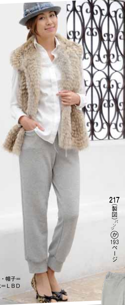
217 (製図) パンツ (か) 193 ページ

大人カジュアルなスウェットパンツ。 ロックミシンだけで縫えちゃうなんて、信じられる!?